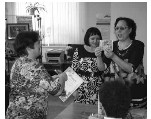
«ЮБИЛЯРЫ» ПОЛУЧАЛИ ПОДАРКИ