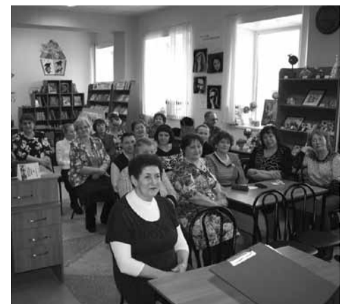
ЗРИТЕЛИ И УЧАСТНИКИ ПРАЗДНИКА

НА РЕМОНТ БОЛЬНИЦЫ ОБЛАСТЬ ВЫДЕЛИЛА 39,1 МЛН.РУБ