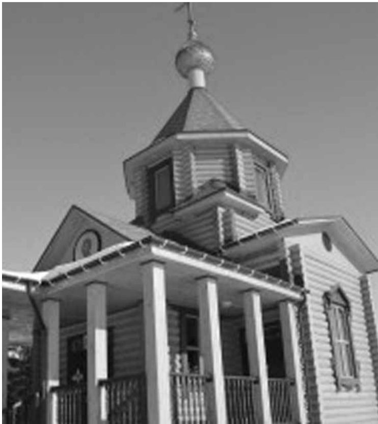
НОВАЯ ЦЕРКОВЬ В ГУБИНО ОТКРЫТА 6 МАРТА 2016 Г

ХРАМ СВЯТИТЕЛЯ НИКОЛАЯ ЧУДОТВОРЦА Д. ГУБИНО ТОМСКОГО РАЙОНА ОСВЯЩЁН 6 МАРТА 2016 Г.!