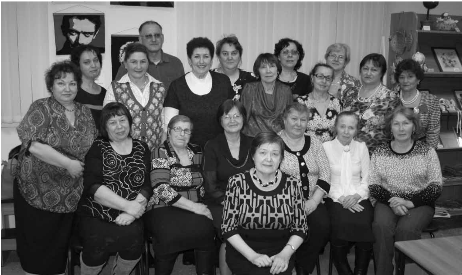
СКОЛЬКО НЕРАВНОДУШНЫХ, ТВОРЧЕСКИХ, НЕУНЫВАЮЩИХ ЛЮДЕЙ ЕСТЬ У НАС ПОСЁЛКЕ