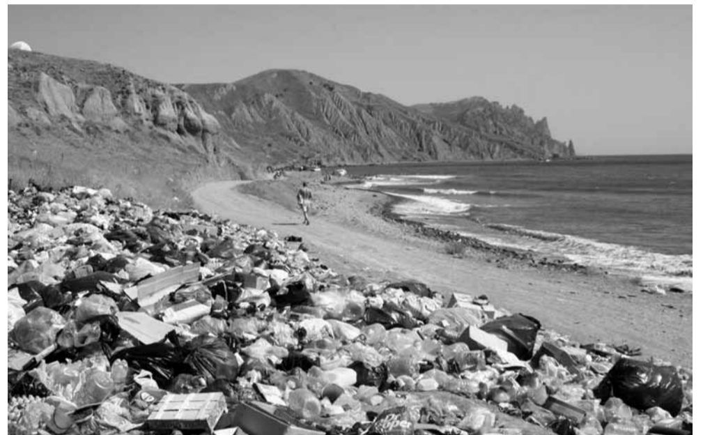
ДАЖЕ ЗОНЫ ОТДЫХА НЕ ИЗБЕЖАЛИ ТОТАЛЬНОГО ЗАГРЯЗНЕНИЯ

Лучше всего со своим мусором справляется Швеция, перерабатывая 52% от общего количества отходов. За ней следует Австрия (49,7%) и Германия (48%). России, с 25%, есть на кого равняться.